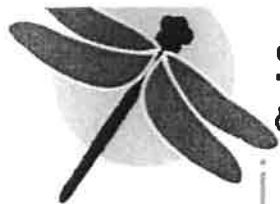
Schéma d'Aménagement & de Gestion des Eaux ill-nappe-rhin

La Commission Locale de l'Eau regrette également que les nombreuses remarques émises lors du processus de concertation n'aient pas été prises en compte et que l'Etat revienne sur son engagement « de réversibilité du stockage » pris lors de la mise en service de Stocamine.